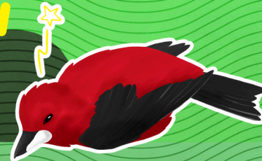
3 - Ave sobreviveu

Observe-a por um tempo e verifique as condições físicas e vitais