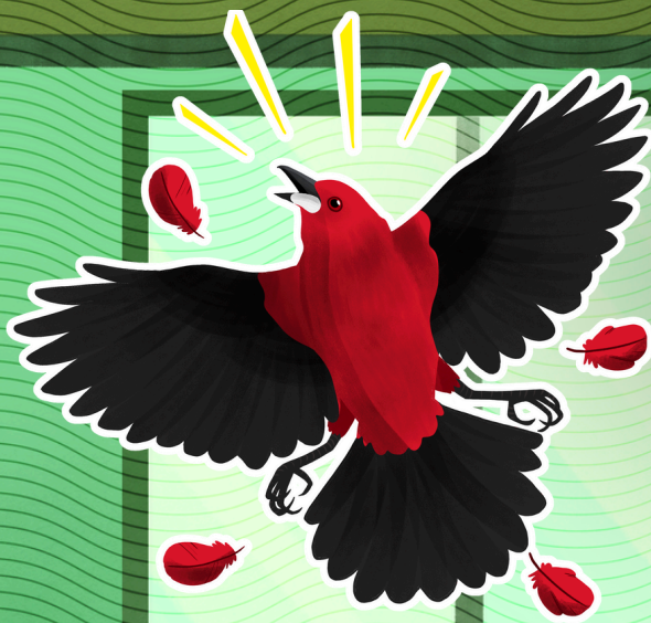
1 - Ave colidiu

A ave pode morrer imediatamente ou sobreviver. Muitas pessoas não sabem o que fazer nessas situações. Abaixo trazemos algumas orientações.