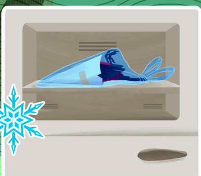
2.1.2 - Acondicione no freezer

O congelamento preserva o animal até sua destinação correta