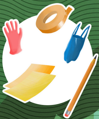
2.1.1 - Armazene a carcaça

Contate a Polícia Ambiental, um centro de triagem de animais silvestres (CETAS/Ibama), a Secretaria do Meio Ambiente ou até clínicas veterinárias