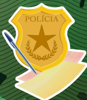
2.1.3 - Faça um boletim de ocorrência policial

O congelamento preserva o animal até sua destinação correta