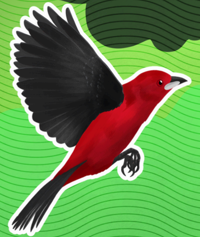
3.2 - Ave recuperou-se sozinha

A ave pode morrer imediatamente ou sobreviver. Muitas pessoas não sabem o que fazer nessas situações. Abaixo trazemos algumas orientações.