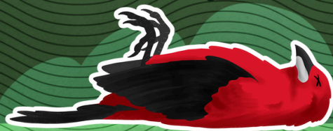
2 - Ave morreu